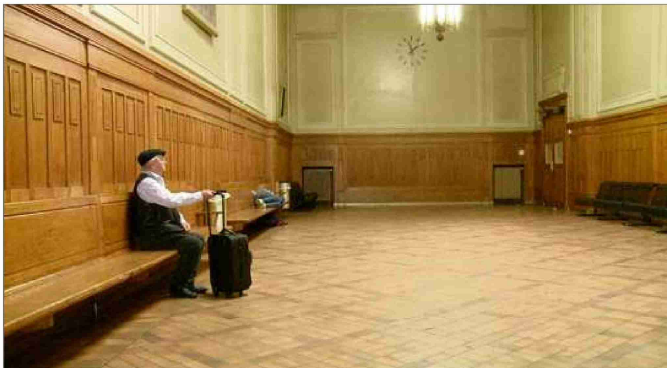
L'écrivain Peter Bichsel attend à Bâle le train qui l'emmènera, pour la première fois, à Paris: il craint que la réalité ne le déçoive.

L'écrivain alémanique est le héros de «Chambre 202», formidable documentaire qui le confronte à la ville qu'il admirait jusque-là dans son seul imaginaire: Paris. Un pur bonheur